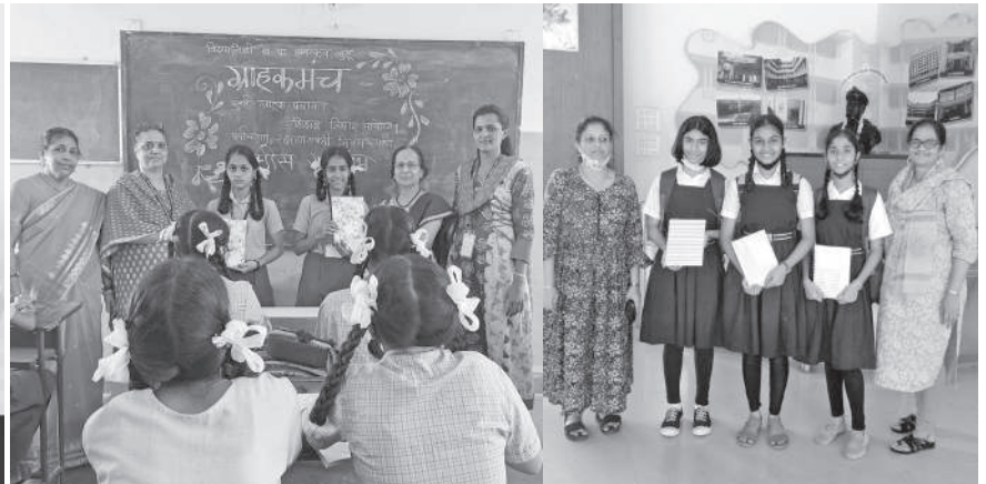
विद्यानिधी स्कूल विजेते