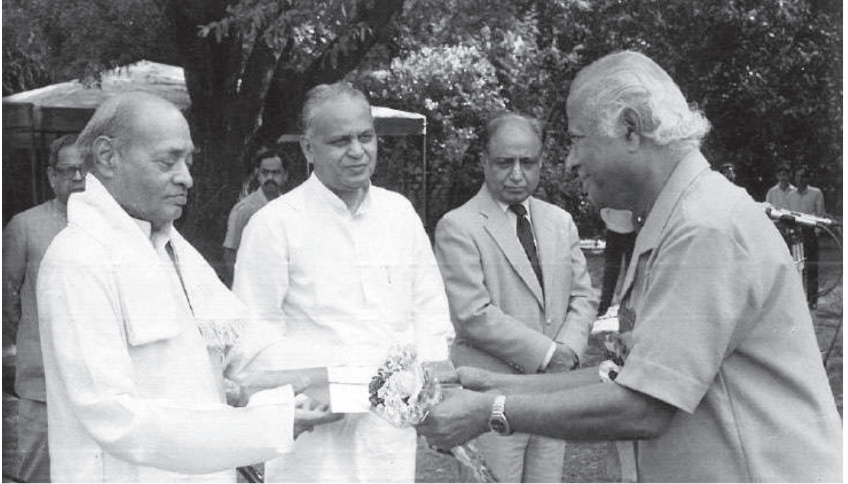
मुं.ग्रा.पंचायतीला मिळालेला राष्ट्रीय पुरस्कार पंतप्रधान नरसिंहराव यांच्याकडून स्वीकारताना - १९९२