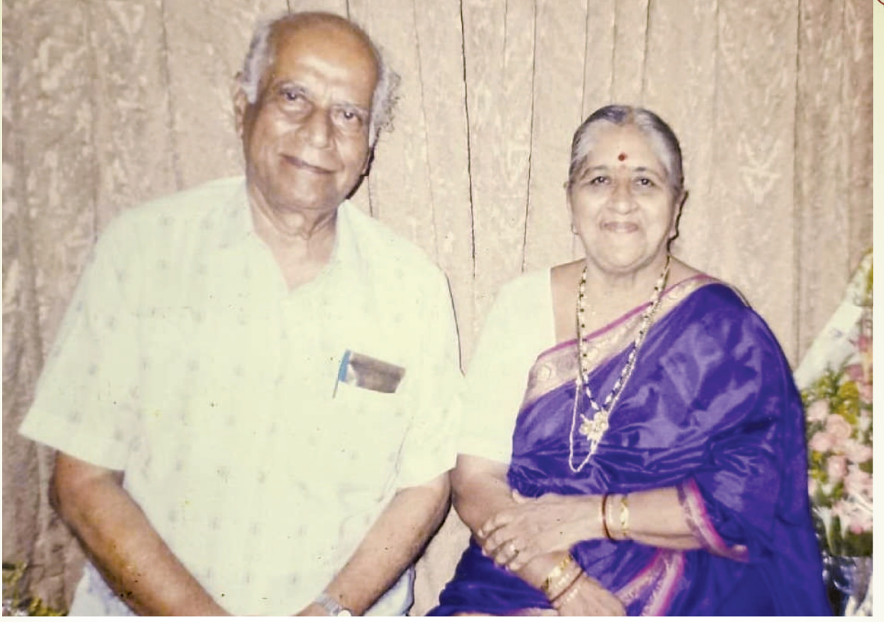
पत्नी - शोभनासह