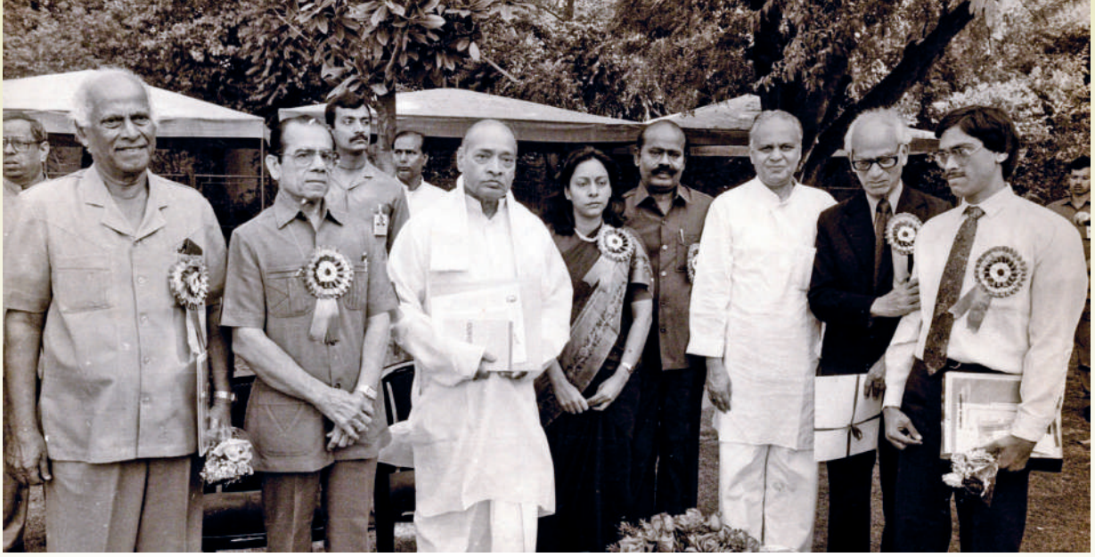
राष्ट्रीय पुरस्कार स्वीकारल्यानंतर पंतप्रधान नरसिंहराव आणि अन्य मान्यवरांसमवेत