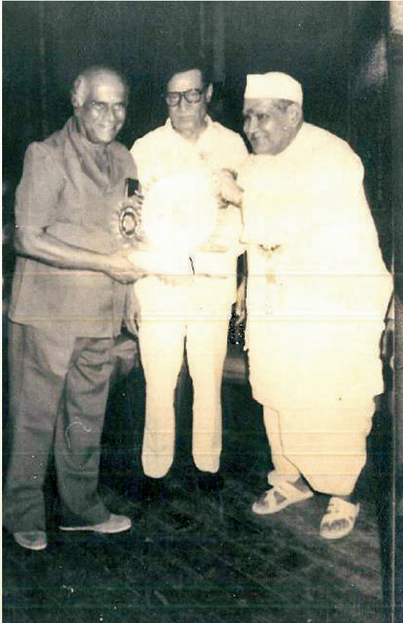
इंटरनॅशनल सिंधी असोसिएशनतर्फे त्यावेळचे राज्यपाल डॉ. शंकर दयाल शर्मा यांच्या हस्ते 'झुलेलाल अँवॉर्ड' स्वीकारताना - १९८७