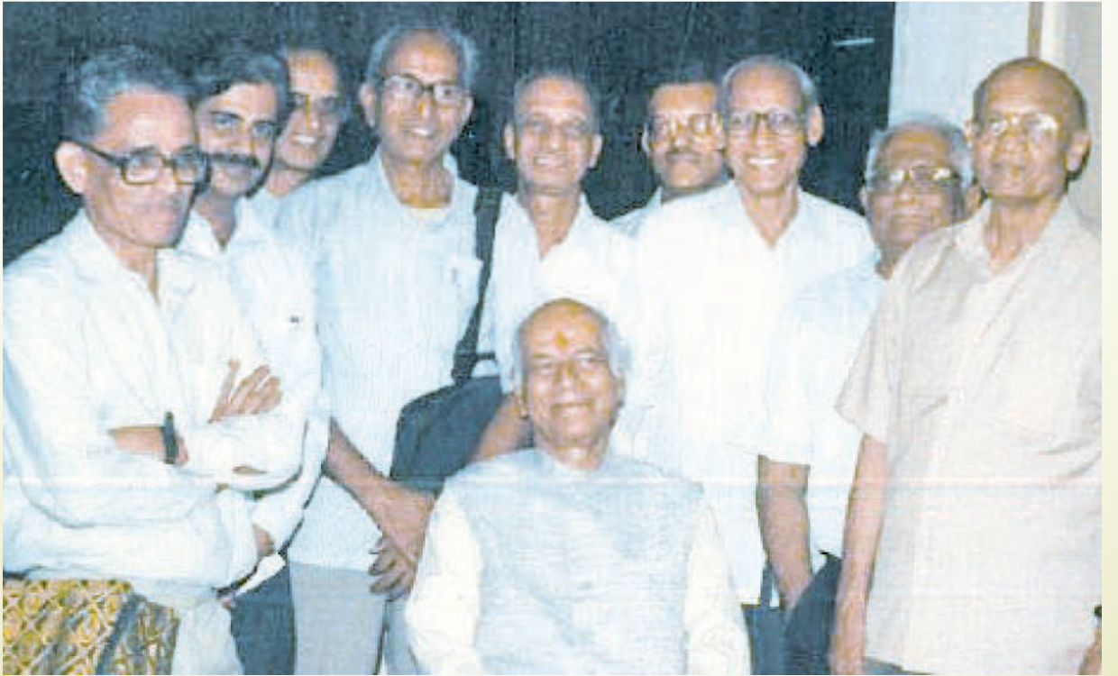
मुंबई ग्राहक पंचायतीच्या कार्यकर्त्यांच्या गोतावळ्यात