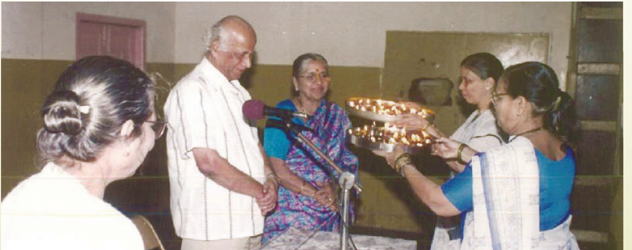
सत्तराव्या वाढदिवसानिमित्त गिरगाव विभागातर्फे आयोजित सोहळा