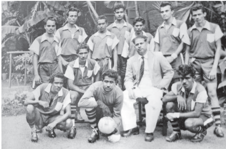
1959 - Indian Sailors Home, Football Team

narrated her story at home, Bapu immediately consoled her with police protection and freed her from the marriage abuse. She looked upon Aai-Bapu as parents as she was all alone. The 4 year old grew up in a special school at Madras and fixed up her own marriage at 18 yrs. Aai-Bapu have many more such virtuous stories to their credit, and perhaps we all are the beneficiaries of those blessing today. ♦